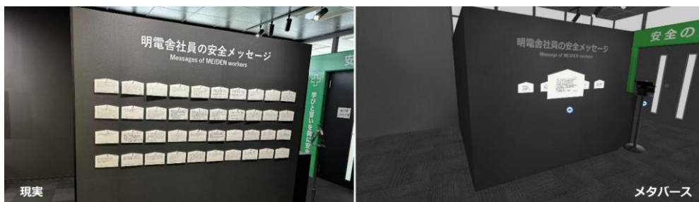
明電グループ社員の「安全への誓い」(絵馬)を掲示