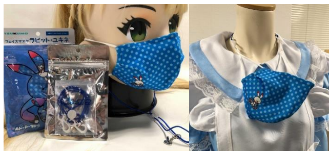
「ユキネマスク」 & 「ユキネマスクホルダー」