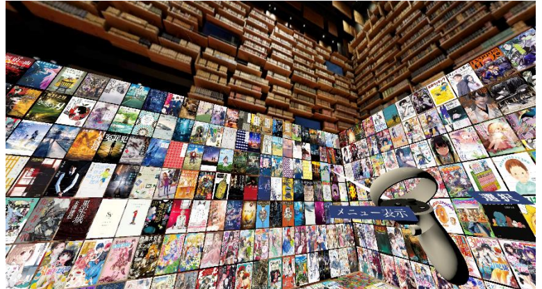
「本棚劇場」の VR 空間