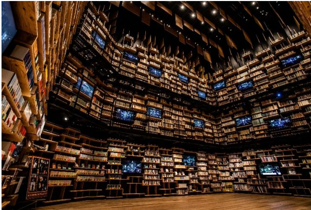
「本棚劇場」