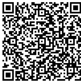
KADOKAWA アプリ QR コード