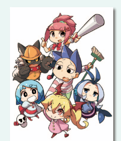
*コミックは4誌ともに漫画:車島晋一郎

さらに1月から毎週火曜日にフラッシュアニメをニコニコ動画で配信し、ニコニコ生放送でも『10年やってもいいですか? 地獄ようちえん@ニコ生大放送』を毎月第3火曜日の23時よりお届けしています。