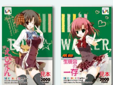
販売価格:各2,000円 販売期間:2012年12月20日~2013年2月28日 (現在は販売を終了しております。)

ブックウォーカーは、昨年12月20日より期間限定で紀伊國屋書店様、アニメイト様の一部店舗にて、電子書籍ストアBOOK☆WALKER専用WebMoneyのオリジナルプリペイドカード、「BOOK☆WALKERカード」を販売しました。