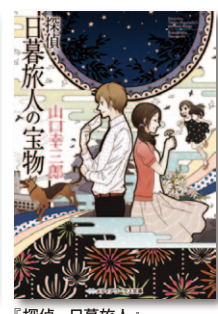
『探偵・日暮旅人』シリーズ累計25万部