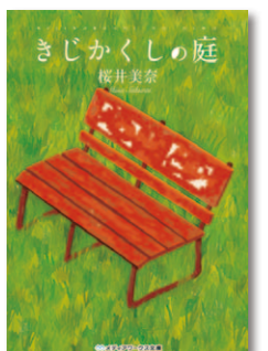
『きじくしの庭』 著者：桜井美奈 定価：599円(税込)