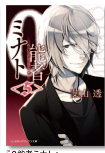
『0能者ミナト』シリーズ累計30万部