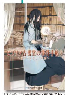
『ビブリア古書堂の事件手帖』シリーズ累計470万部

A. フリー編集を加えた19人の編集者が「電撃文庫」「メディアワークス文庫」「電撃文庫MAGAZINE」の編集を兼任しており、レーベルごとに編集者を固定していません。この人員で